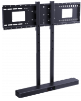
1 x VFM-WSB EU SAP: 6990143 vav.link/vfm-wsb