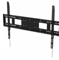
1 x Suporte de parede de resistência elevada para ecrãs planos 1000x600 VFM-W10X6 EU SAP: 4934297 US SAP: 13557609 vav.link/pt-pt/vfm-w10x6