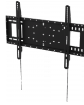
1 x Suporte de parede de resistência elevada para ecrãs planos 600x400 VFM-W6X4 EU SAP: 4996384 US SAP: 13557604 vav.link/pt-pt/vfm-w6x4